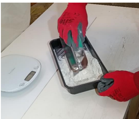
Mélange de la gâche pour obtenir une texture épaisse 1 demi-litre d'eau / 1 kg d'enduit Reboucheur Express