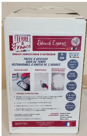
5 kg enduit de Rebouch'Express